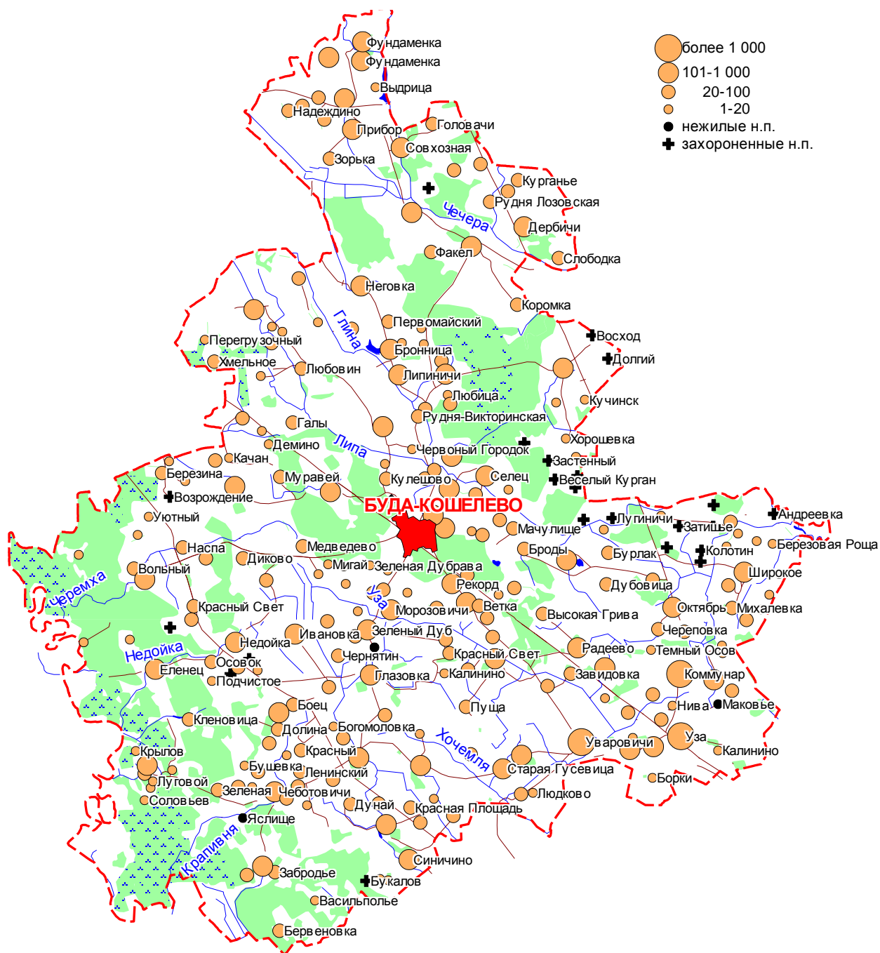
Карта-схема Буда-Кошелевского района Гомельской области

Перечень населенных пунктов, где за 2007 год выявлены случаи превышения РДУ по содержанию радионуклидов в молоке личных подсобных хозяйств: